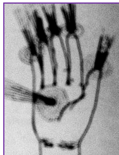
energie Shambally vyzařovaná z ruky

Zasvěcení působí přes Ketherické tělo až na fyzické vrstvy. Při používání Shambally prochází energie do všech vrstev aury a systému těl (včetně všech čaker). Jak energie prochází, léčí.